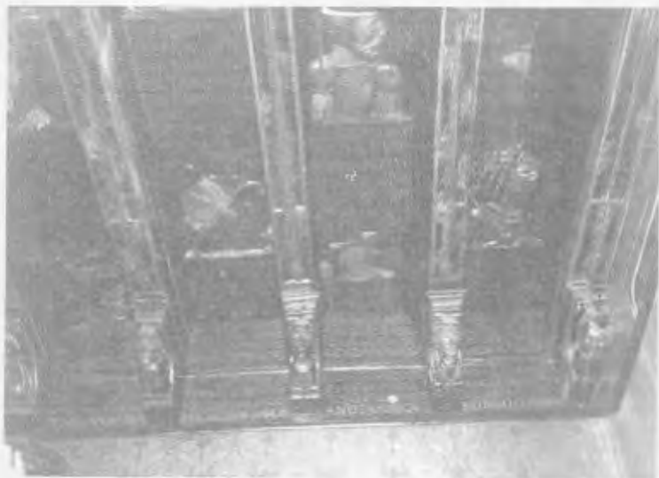
GRANADA. — Artesonado de la Casa de los Tiros.