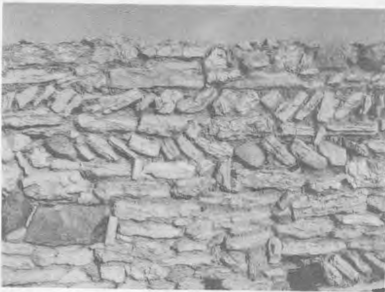
Tapia de un corral en Paracuellos de Jiloca.