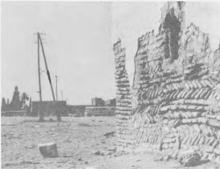
Construcción extramuros en Marrakech.