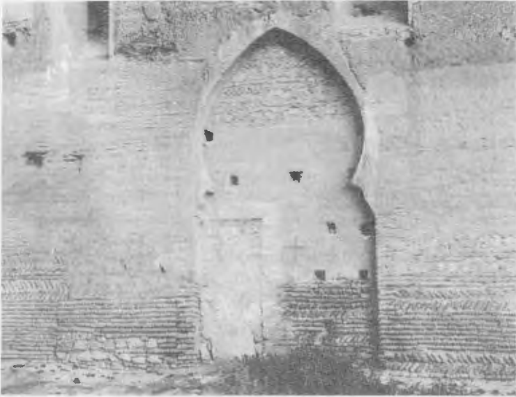
Muro Norte de la mezquita de la Kutubiya, Marrakech.