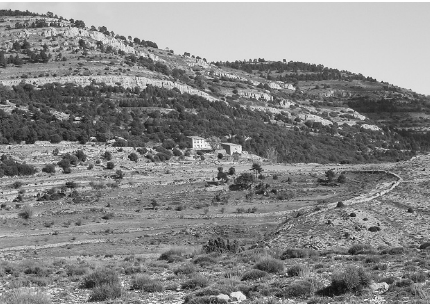
Área de influencia de un mas en un espacio árido