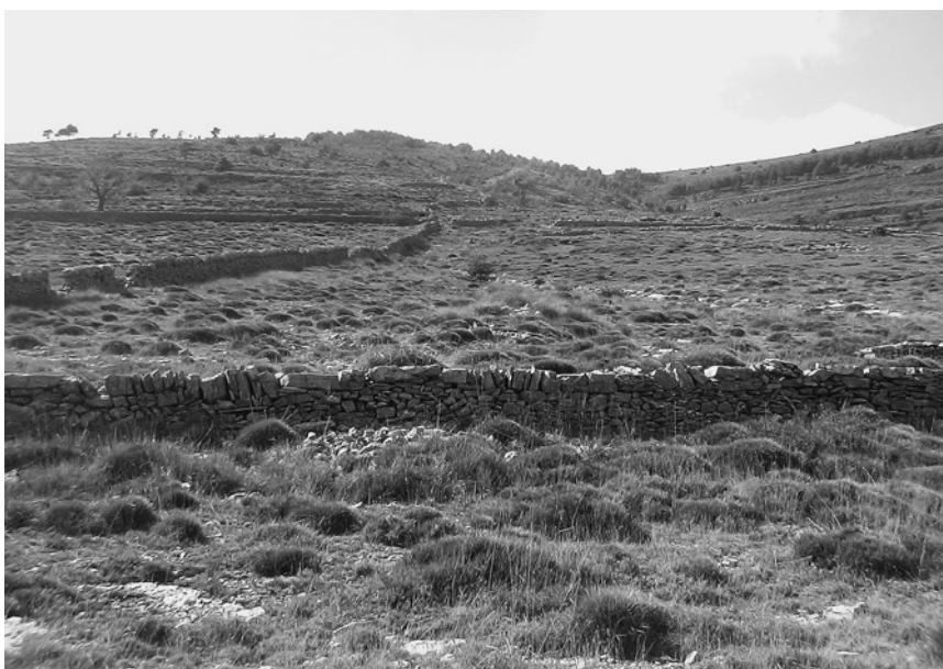
Vegetación natural de El Puerto