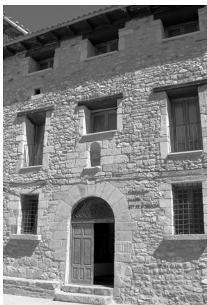
Edificio que albergó al hospicio de Santa María de Gracia