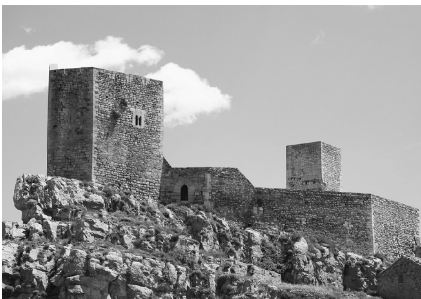
Castillo de Puertomingalvo en la actualidad