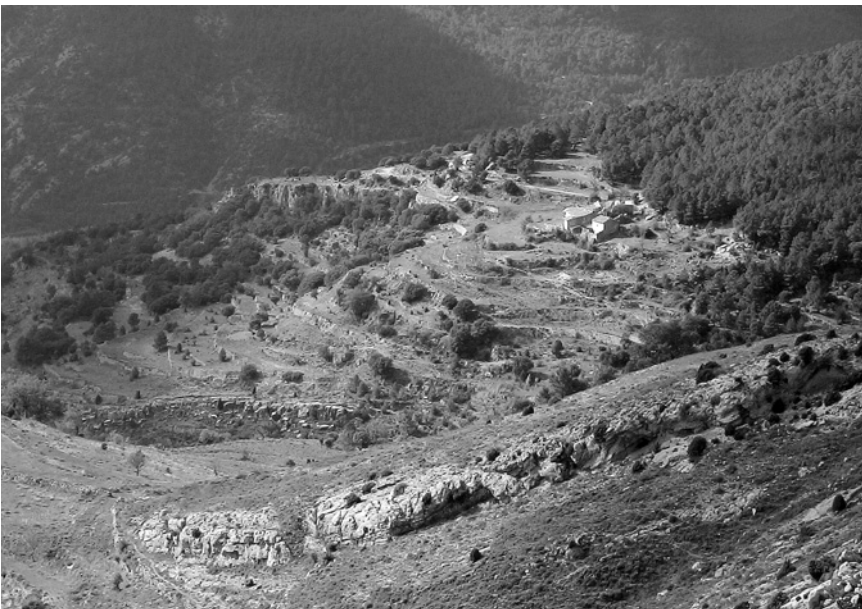
Montes de Puertomingalvo con masía al fondo