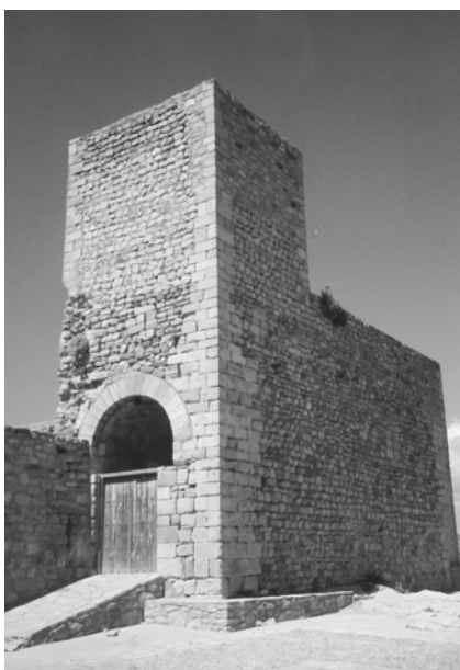
Torreón del castillo