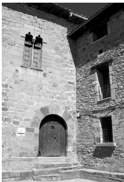
Fachada del ayuntamiento en la plaza Nueva