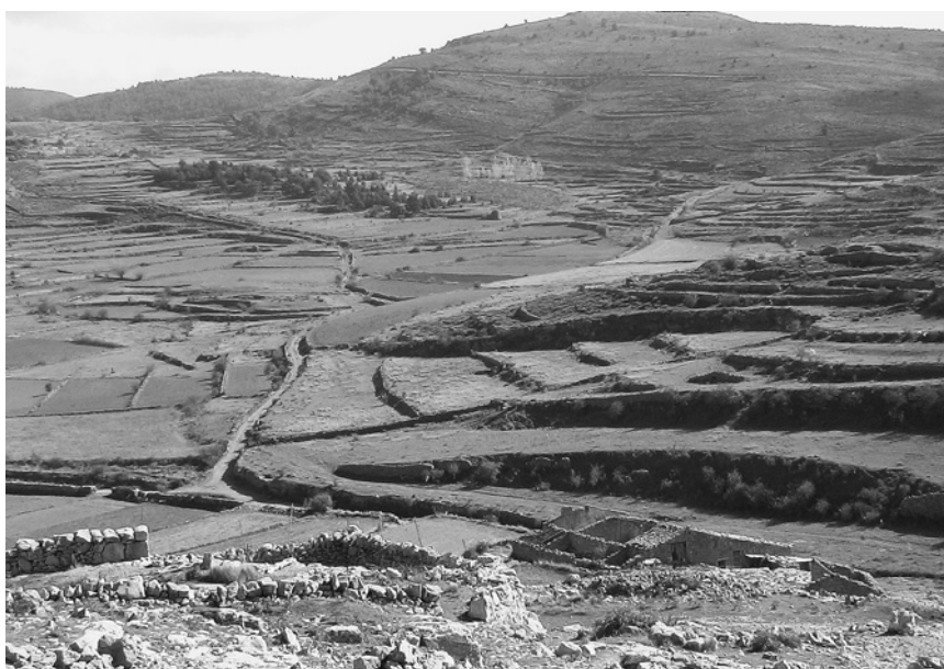
La construcción del suelo agrícola