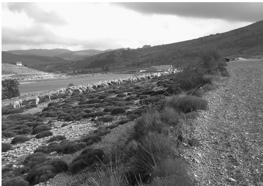
Cañadas y tierras de cultivo