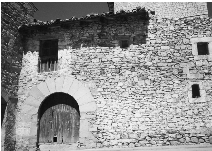
Antiguo hospital de Gracia situado junto al Portal Alto