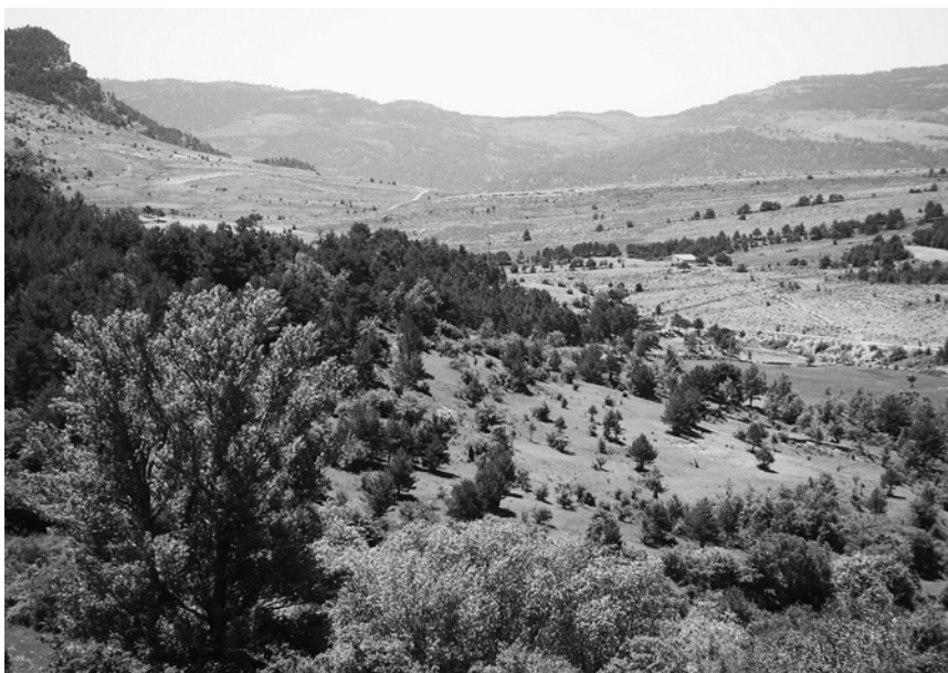
Puertomingalvo. Montañas y vegetación típica de la zona