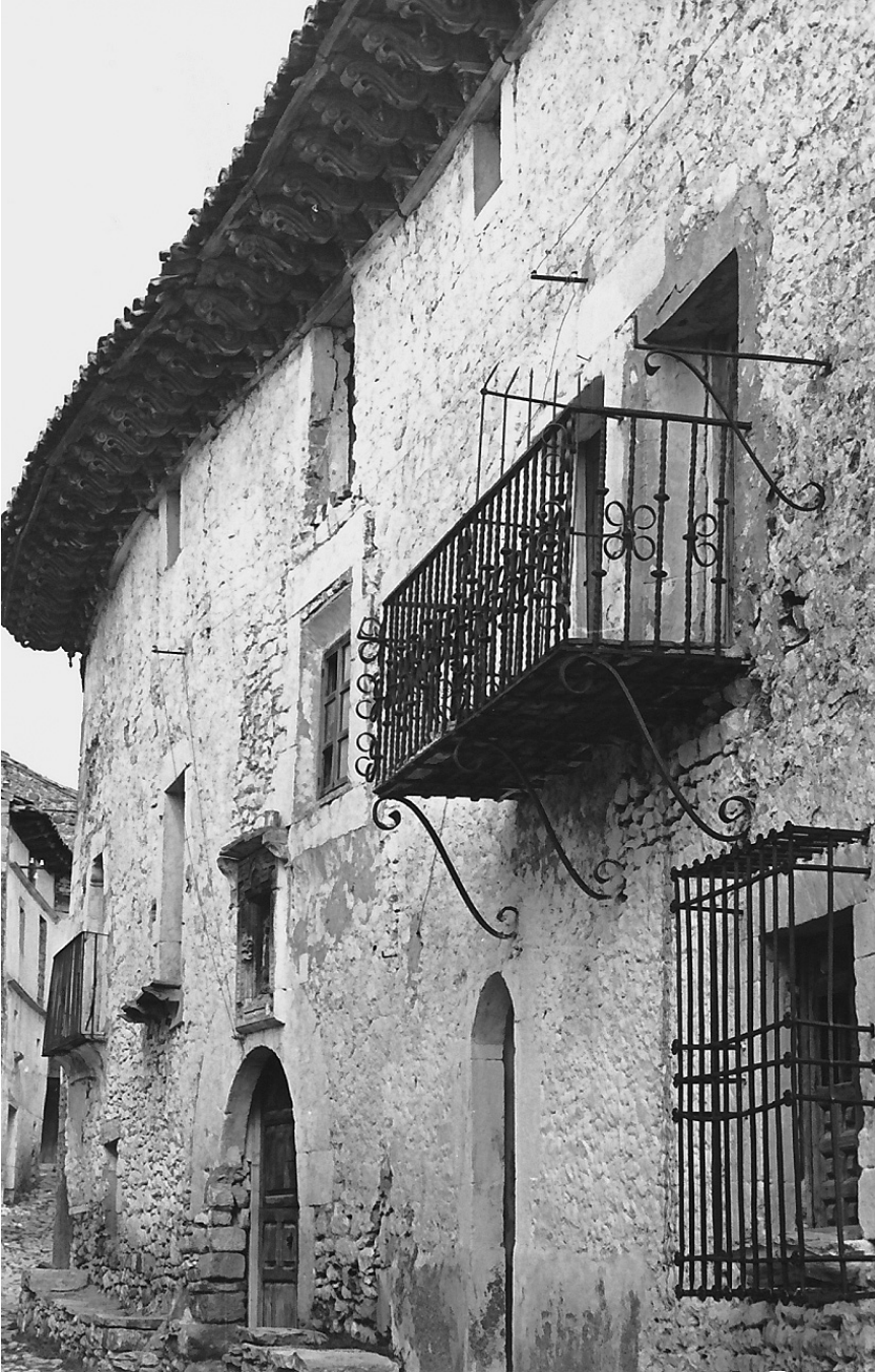
Fachada de una de las casas de la calle Mayor a mediados del siglo XX