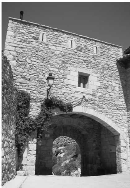
Fachada interior del Portal Alto recientemente restaurado