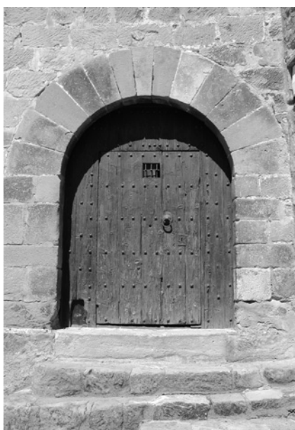
Puerta de acceso al ayuntamiento desde la plaza Nueva