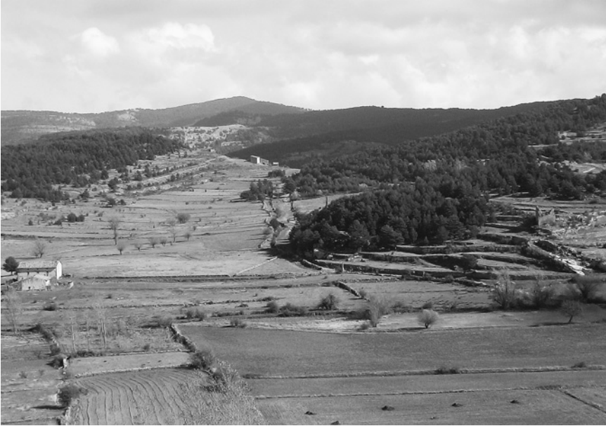
Tierras feraces inmediatas a la villa y vías de acceso al monte