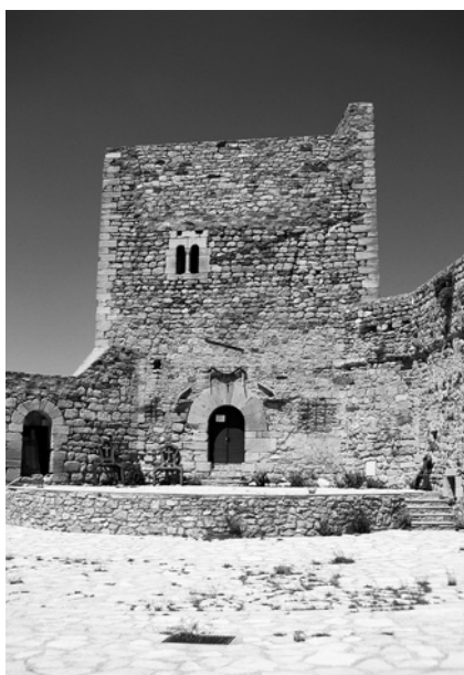
Torre del Homenaje en el castillo de Puertomingalvo