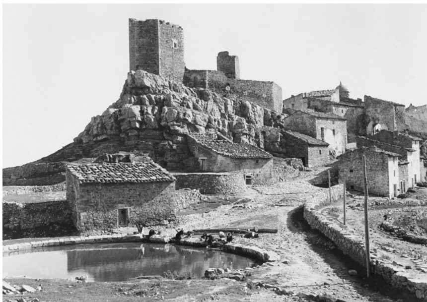
Vista de Puertomingalvo en los años cincuenta del siglo XX