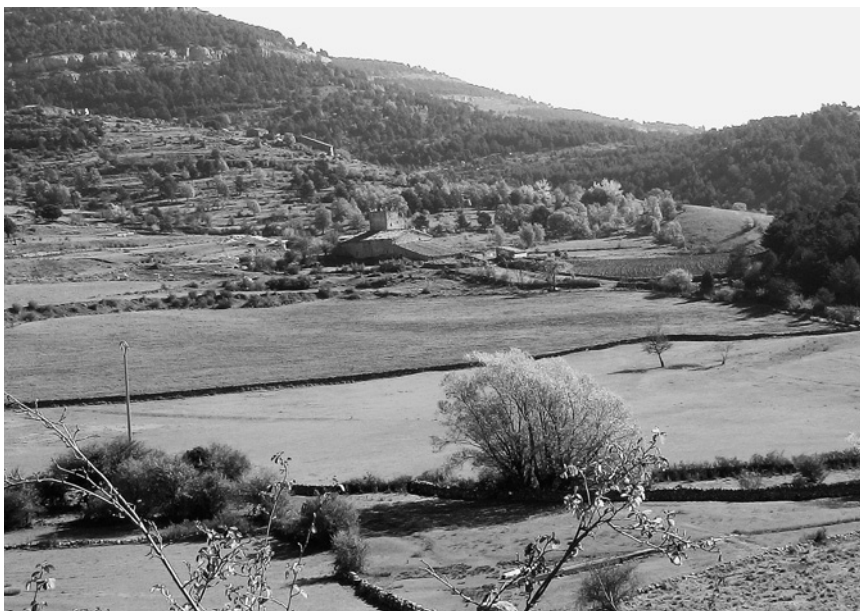
Masía Torre de Puertomingalvo